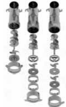
Standard o enterprise 1/2 Unger Unger Totale