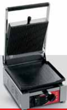
ELIO LR TIMER