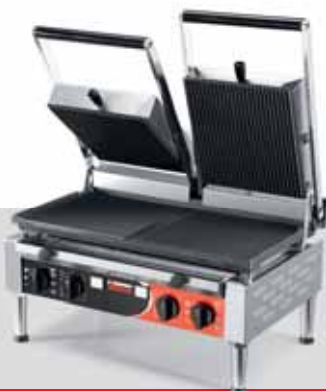
PD MR POWER TIMER