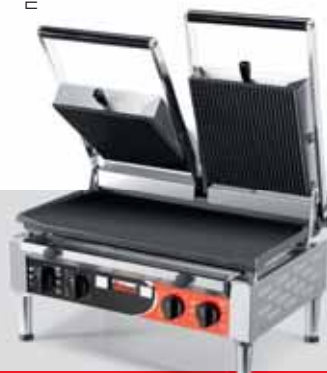
PD LR POWER TIMER