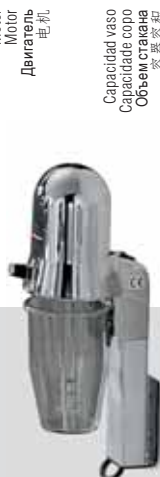
SIRIO 1P VV