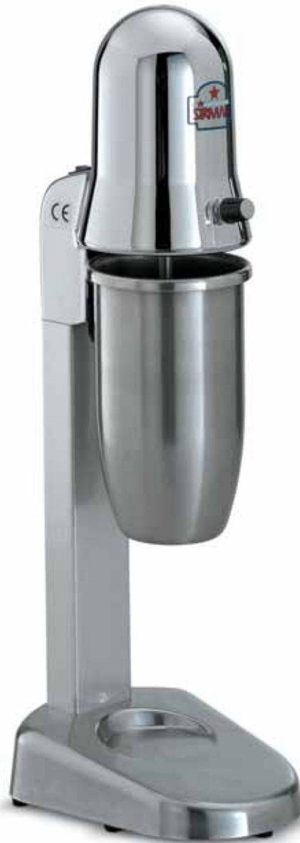
SIRIO 120W 900 CC