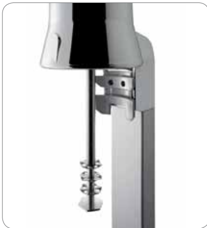
1. Particolare fruste, Sirio 120 watt - 900cc Sirio 120 - 900 watts agitators