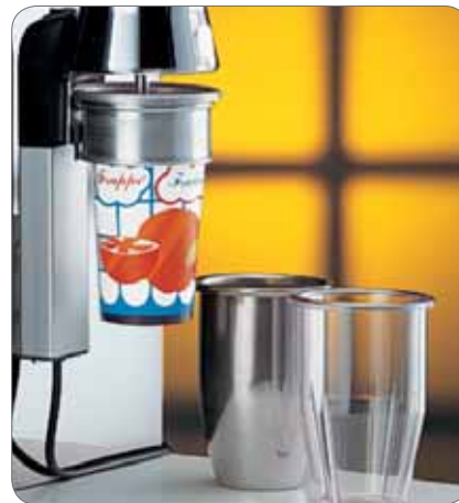
2. Opzionale: Anello portabicchieri usa e getta Optional: ring for paper cups