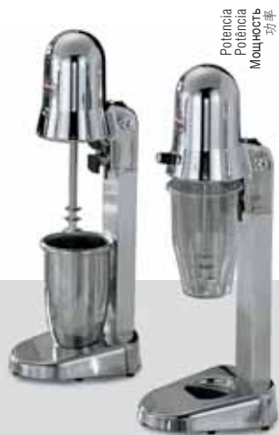
SIRIO 1 / SIRIO 1 VV