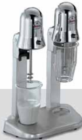
SIRIO 2 VV