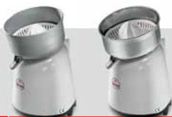
APOLLO ECO / APOLLO