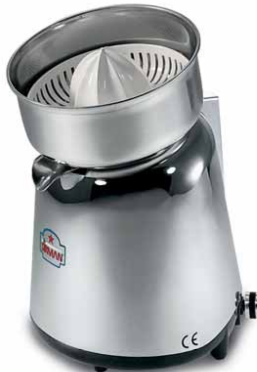
APOLLO CROMATO VV