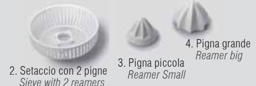
2. Setaccio con 2 pigne Sieve with 2 reamers