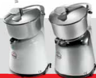
APOLLO CON LEVA VV