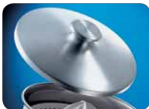
1. Opzionale: Coperchio Optional: Lid